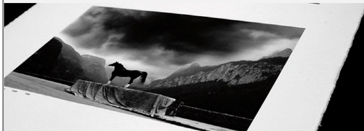
L'applicazione fine art su cotone realizzata con tecnologia Durst

Fujifilm ha lanciato la più recente release, la versione 3, della propria soluzione Web-to-Print, cloud-based Xmf PrintCentre V3, dotata di nuove funzionalità. Xmf PrintCentre consente alle aziende di stampa di creare più siti web dedicati al commercio elettronico per la vendita di stampe e per gestirne l'intero processo dall'acquisto on-line all'invio dei file Pdf pronti per la stampa a un sistema di produzione come il Fujifilm Workflow Xmf. www.fujifilm.it