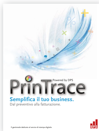
PrinTrace di DPS

PrinTrace è un software gestionale dedicato alle tipografie e service di stampa digitale, creato da un team di informatici ed esperti del settore. Ricco di funzioni per un utilizzo rapido e orientato al risparmio dei tempi, PrinTrace by DPS ti consente di creare preventivi e inviarli per email al cliente con un click. Duplica un preventivo master, imposta le informazioni e ricalcola i prezzi, sconti, e tutti i parametri per il nuovo cliente. www.dpssrl.com