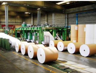
Il centro taglio Polyedra a Parma